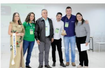
Cafebras – 10 anos Empresa Homenageada 2023