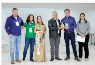
Expocaccer – 30 Anos Empresa Homenageada 2023