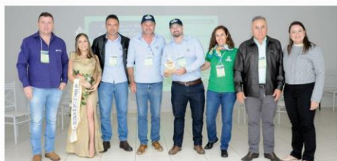
Biofertil Brasil – 10 Anos Empresa Homenageada 2023